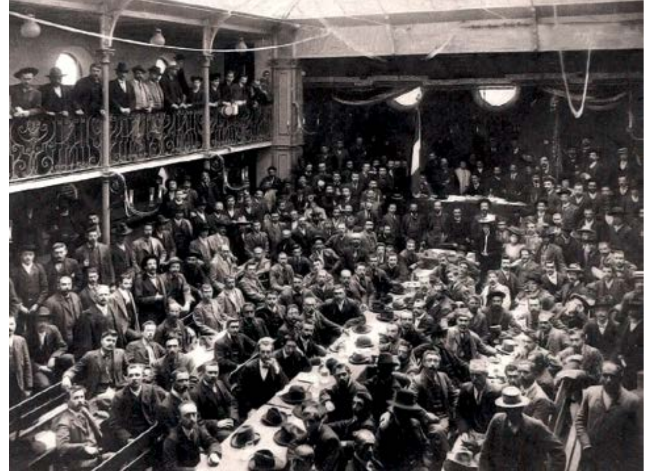
Nella pagina a fianco, Friedrich von Hayek. Qui sopra, la fondazione della CGIL, che allora si chiamava Confederazione Generale del Lavoro (CGdL), il 1° ottobre 1906 a Milano

Dal punto di vista dei cittadini, insomma, tutta una serie di impegni "non dovuti" ha bisogno di situazioni in cui si sente di prendere parte a un'iniziativa comune e, se possibile, si fa gruppo. Lo Stato è un'entità troppo astratta e distante per tutto questo. In linea generale, per noi non è qualcosa a cui si partecipa o si accorda fiducia, ma qualcosa nei confronti del quale si hanno diritti e doveri formalizzati (spesso ritenendo di avere troppi doveri e troppo pochi e mal garantiti diritti). Peggio ancora oggi, quando