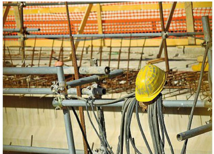
Simbolo Un casco giallo appeso in un cantiere. Secondo l'Associazione dei costruttori edili di Roma ci sono 200 milioni di progetti fermi che potrebbero dare lavoro e infrastrutture moderne ai cittadini