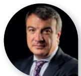
Giuseppe Crupi Abitare Co.