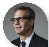
Richard L. Florida Toronto University