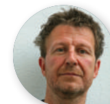
Cino Zucchi CZA Cino Zucchi Architetti