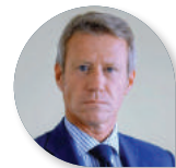
Davide Albertini Petroni Risanamento