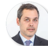
Alessandro Caltagirone Immobiliare Caltagirone